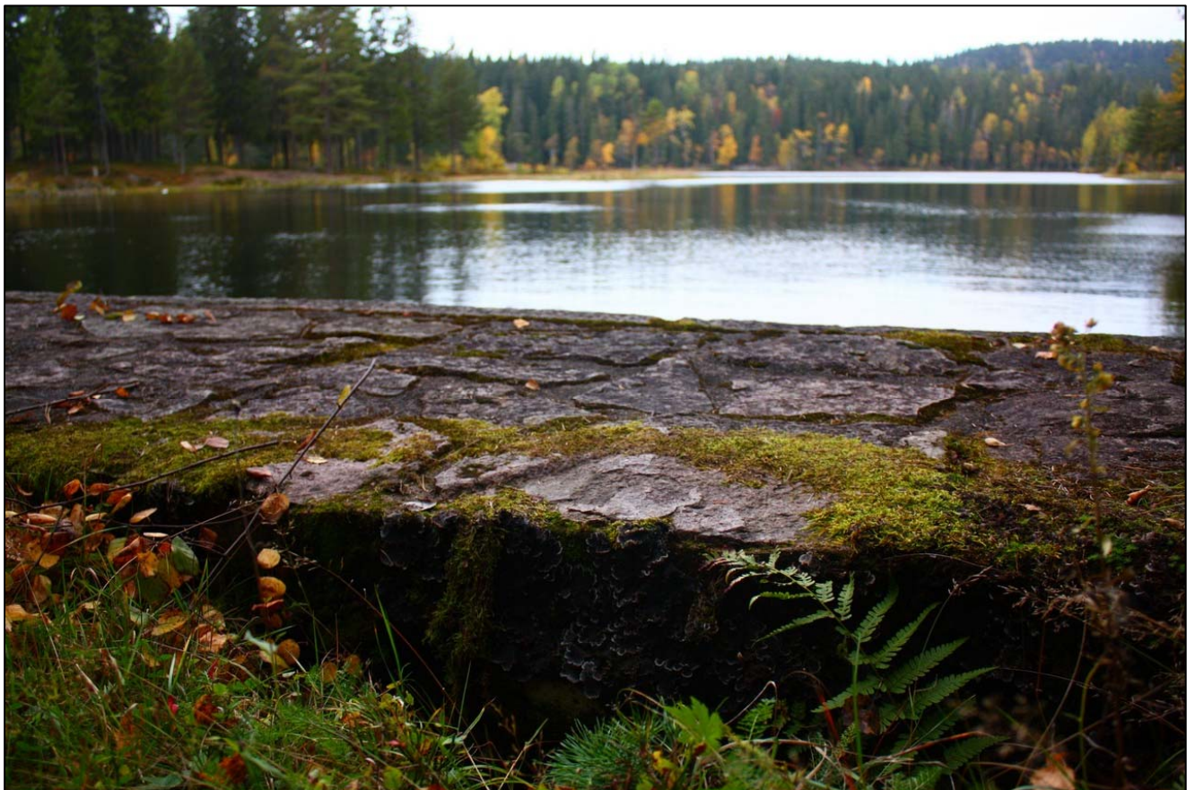
En av Aurevannsdammene