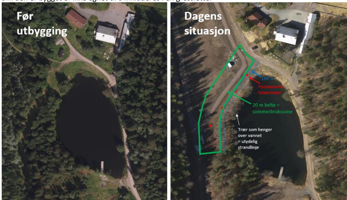
Luftfoto av Kapteinsputten før og etter utbygging av anlegget, med illustrasjon av den 20 m sommerbrukssonen (grønn) og LNF3 (blått). De feilplasserte lyktestolpene (rød) er tegnet inn.

Deler av denne gressbakken var planlagt som tilsådd løype inn mot målområdet (se også utsnitt av landskapsplanen neste side). Isteden har det skjedd en saksbehandlingsfeil ved godkjenningen av landskapsplanen og det er blitt etablert en gruslagt skitrase tvers gjennom BSK2, med en forholdsvis bratt skråning ned til vannkanten. Denne skitraseen er i strid med reguleringsbestemmelse § 5.1, etablert med opphøyet fundament av pukk og grus. I tillegg er det plassert lyktestolper i fyllingen ned mot vannet. Hele dette området er dermed etter utbyggingen uegnet for sommeropphold, og løypa slik den er bygget er ikke egnet til å inkluderes i en gresslette.